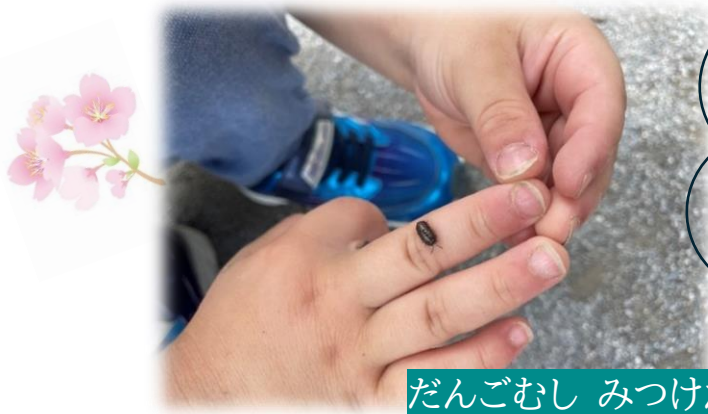
だんごむし 見つけた!